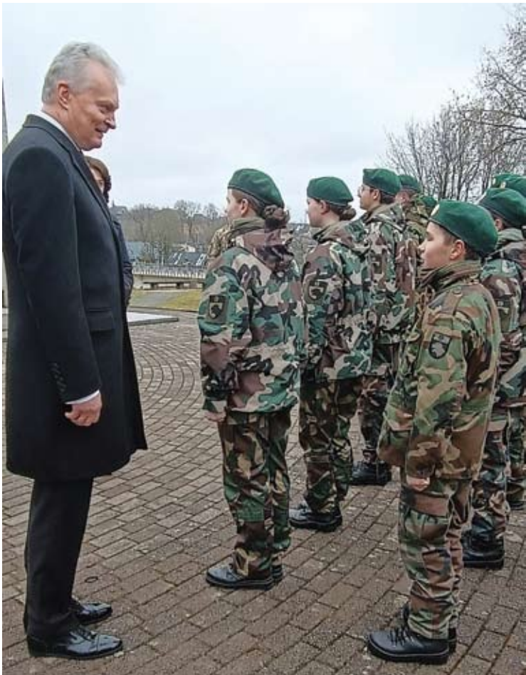
Prie paminklo Antanui Baranauskui Prezidentą Gitaną Nausėdą pasitiko jaunieji šauliai.