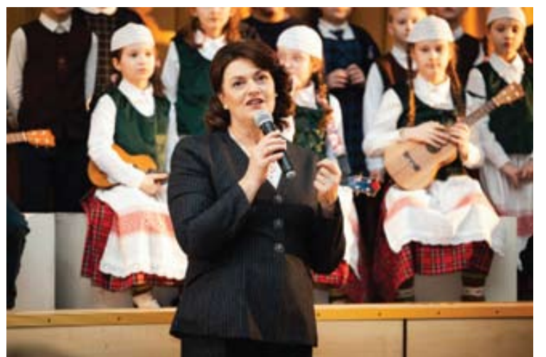
Pirmoji ponia Diana Nausėdienė lankėsi Anykščių Antano Vienuolio progimnazijoje.

Šaltiniai pasakojo, kad apsauga patikrino visą viešbutį, o atėjusiems lankytojams tą vakarą nebuvo leista į pastatą patekti pro pagrindinį viešbučio įėjimą.